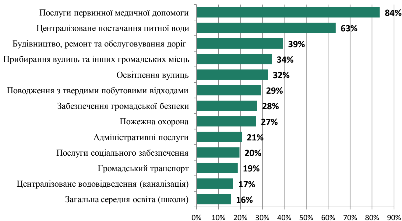
Рис. 2. Які послуги є найбільш важливими для Вас? Найбільш важливі послуги (вісь Y) та відсоток респондентів, які визначили послуги важливою (вісь X).

Відповідно до результатів при опитуванні в розрізі конкретних послуг 84% респондентів визначили медичні послуги як найбільш важливі послуги серед представлених послуг. Централізоване постачання питної води отримало 63% голосів респондентів, а будівництво, ремонт та обслуговування доріг – 39% (Рис.2).