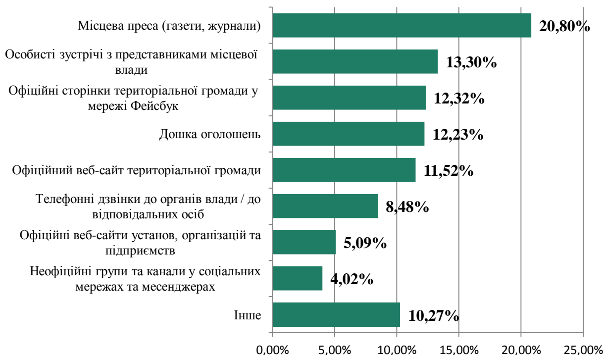
Рис.4. З яких джерел ви отримуєте інформацію про послуги, що надаються у Вашій громаді? Джерело інформації (вісь Y) та відсоток респондентів, які його обрали (вісь X)

Основним джерелом інформації про послуги в громаді є місцева преса. 20,8% респондентів отримують інформації про послуги, що надаються в громаді, саме з місцевої преси. 13,3% респондентів спілкуються з представниками місцевої влади особисто. Офіційна сторінка міської ради в мережі Фейсбук більш популярна як джерело інформації, ніж офіційний сайт громади (12,3% проти 11,5%). Дошку оголошень як джерело інформації про послуги використовує 12,2% респондентів (Рис.4).