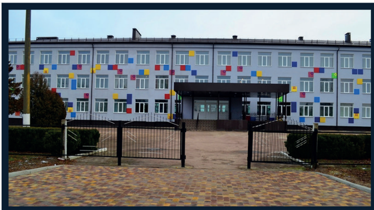
КОРЮКІВСЬКА ЗОШ I-III СТ №1